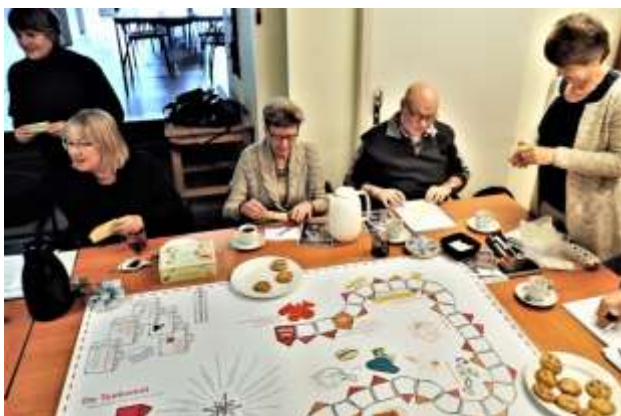
Dak bij de tijd, 13 februari 2017

Het beleidsstuk 'Doorgaan of doorpakken', hoe ziet de toekomst van ons werk eruit?' (2016) werd de onderlegger voor een proeve van een gezamenlijk beleidsstuk voor de beide inloophuizen in Schiedam. In februari bezochten twee bestuursleden van de koepel NETWERK DAK ons nogmaals om aan de hand van