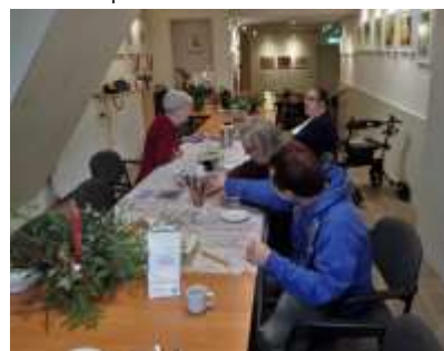
Tweede kerstdag in De Wissel

In plaats van Oudejaarsdag waren we rond de afgelopen Jaarwisseling op Nieuwjaarsdag 2018 open.