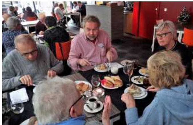
Kerstlunch vrijwilligers in het ProNova College